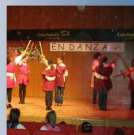
Escuela en Danza