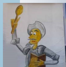
Animación a la Lectura