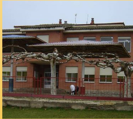
Patio de Infantil